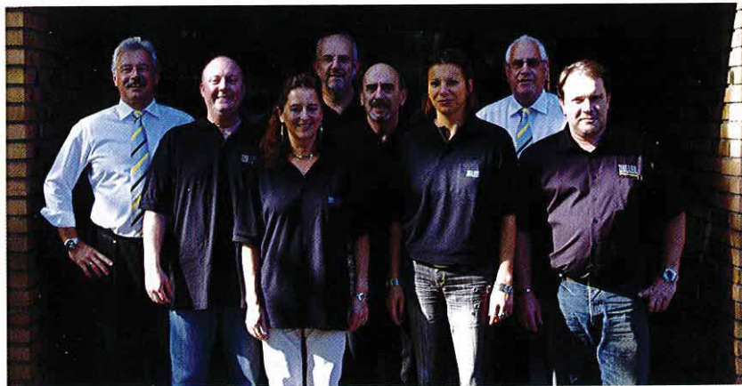
L'équipe ZOLLER France