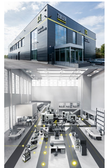
Die ZOLLER Smart Factory in Pleidelsheim zeigt anschaulich, wie Produktivitätsoptimierung, Automation und Industrie 4.0 in der Praxis aussehen können.