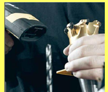
Barcode Scanner für den schnellen und sicheren Datenaufbau