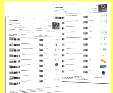
Die Kommissionierliste ermöglicht es schnell und einfach aus Einzelkomponenten Komplettwerkzeuge zu erstellen oder bereits vorhandene Komplettwerkzeuge aufzufinden

Intelligente Softwaremodule wie die ZOLLER-Werkzeugdatenverwaltung, Lagerortverwaltung, Datenausgabe und die NC-Programmverwaltung garantieren in Verbindung mit dem ZOLLER-Messgerät, ausgestattet mit der Bildverarbeitung »pilot 3.0«, einen einfachen und sicheren Werkzeugfluss.