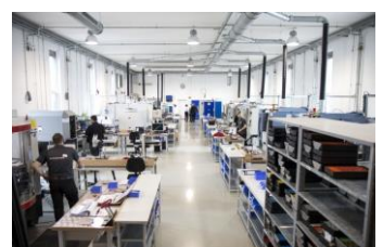
Moderne Schleifmaschinen und führende Messtechnik bei Nachreiner im Werk Balingen