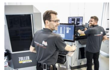
Die Arbeit an ZOLLER-Inspektionslösungen macht Spaß, - und die Betreuung ist so zuverlässig wie das Gerät selbst