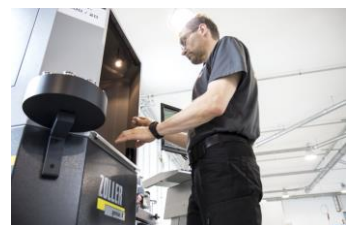
Dokumentierte Qualität dank ZOLLER-»genius« und »pomBasic«