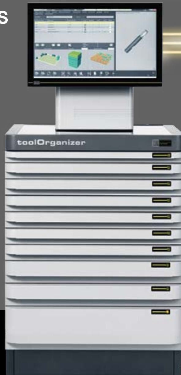
»toolOrganizer« (Lagerschrank mit einer Nutzhöhe von 900 mm, inklusive neun Schubladen und Toolmanagement-Software)